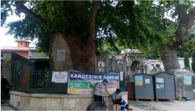
Resim 14 Eyüp Camii

Bu görselde “Namazda gözü olmayanın ezanda kulağı olmazmış” atasözünün Eyüp’te vücut bulmuş hali. Neden camilerimize şu çirkin altın sarısı ledli levhaları reva görecektik kadar zevksiz olduk acaba. Bunun birde hadisli olanı var. Çok şükür buraya konulmamış.