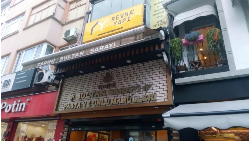
Resim 23 Eyüp/ Fahri Korutürk Caddesi

Burada Eyüp tarihi merkezinde bulunan binalarla birlikte Ankara ve Safranbolu’da yer alan tarihi alanlardan da örnekler verilmiştir.