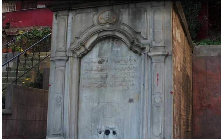
Resim 4 Eyüp/ Silahtarağa Abdullah Ağa Çeşmesi