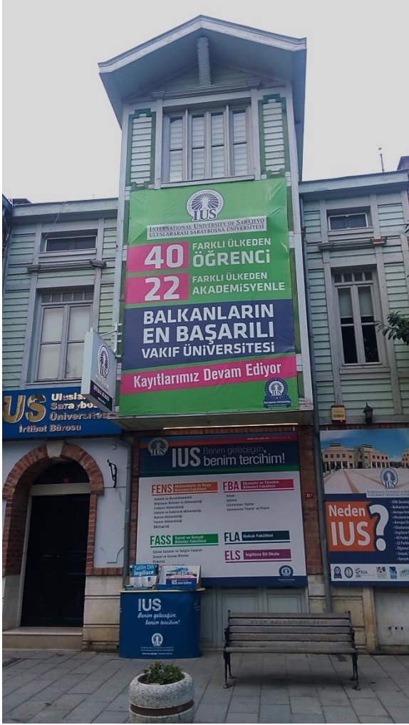
Resim 21 Eyüp/ Feshane Caddesi