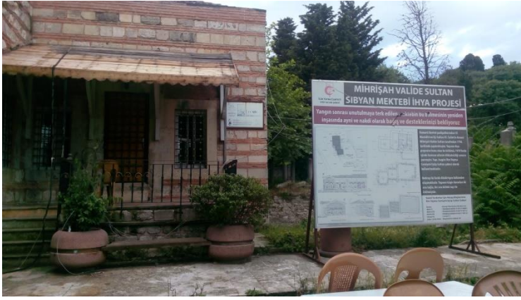
Resim 11 Eyüp/ Beybaba Sokak/ Mihrişah Valide Sultan Sıbyan Mektebi

Kemerli taş bir kapıdan geçtiniz ve karşınıza şöyle bir avlu çıktı. Ne düşünürdünüz? Bu ne böyle ne kadar berbat izbe bir yer mi? Ben böyle düşündüm. Ne veya neresi olduğunu bilmediğim bu mekânın kapısından kafamı uzattığımda merak etmesem içeri davet edeceği yerde kaç kurtar kendini diyen bu mekâna girdim. İyi ki de girmişim. Gözlerim gördüklerine inanmasa da buranın bir sıbyan mektebi olduğunu görünce ruhumdan bir şeyler kopmuş gibi oldu.