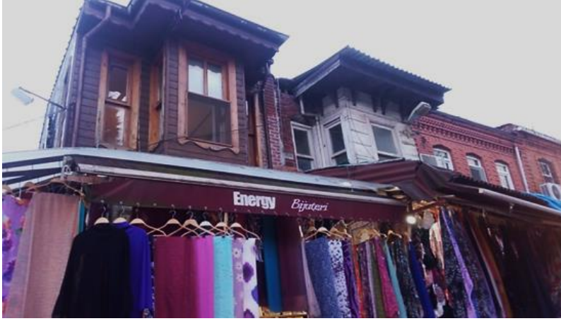
Resim 17 Eyüp/ Cami Kebir Caddesi

Energy kelimesine gözünüz takıldı ise arkadaki muhteşem yapıyı nasıl görebilirsiniz ki!!!