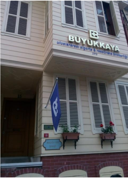
Resim 27 Eyüp/ Feshane Caddesi

Bizim mekânı incelemeden olmaz. Diğer birçok binaya göre daha güzel korunmuş halde. Şu kırmızı kapı numarası da olmasa daha da güzel olabilir.