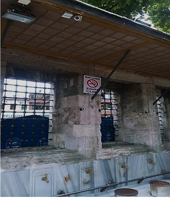
Resim 15 Eyüp Camii

İbadethanede sigara içmeyecek kadar duyarlı ama aynı ibadethanenin zarafetini hiçe sayacak kadar umursamaz.