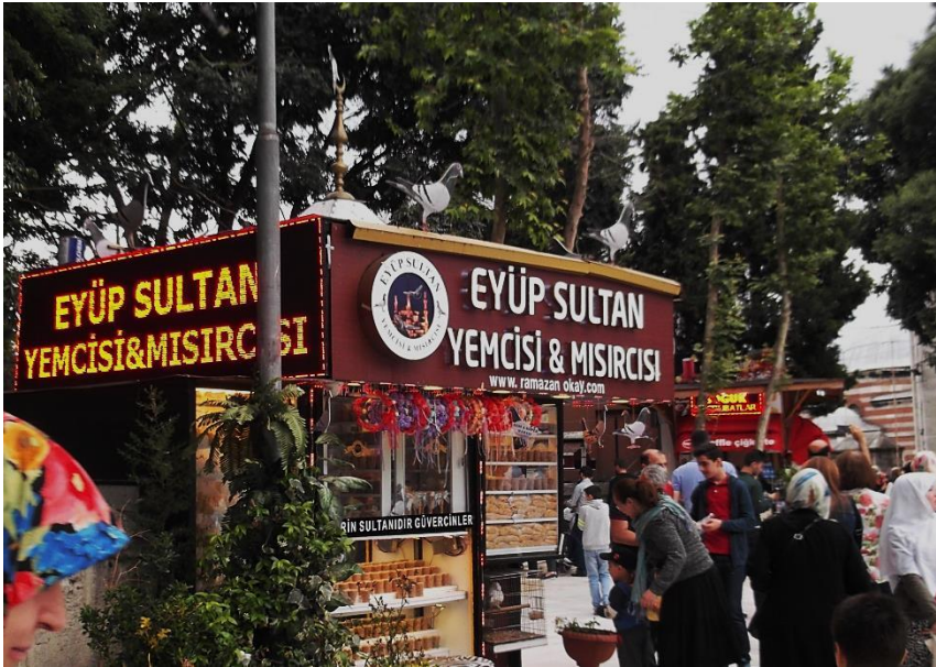
Resim 10 Eyüp Meydan

Şehrin ruhunu en iyi ifade eden mekân olan Eyüp 'ün meydanına biraz dışardan baktığımızda bunun ne kadar doğru olduğunu anlıyoruz. Ruhumuzun tam orta noktasında dev bir ekran, etrafında kargaşa ve bekleyiş var.