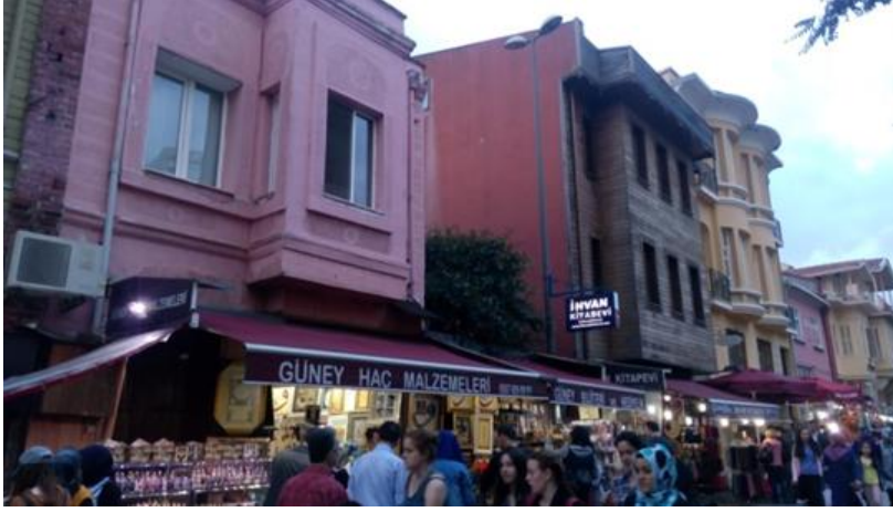
Resim 19 Eyüp/ Feshane Caddesi

Bir başka güzel sokak. Ama fotoğrafı ortadan ikiye bölüp üst kısma bakarsanız. Elinizle kapatsanız da olur.