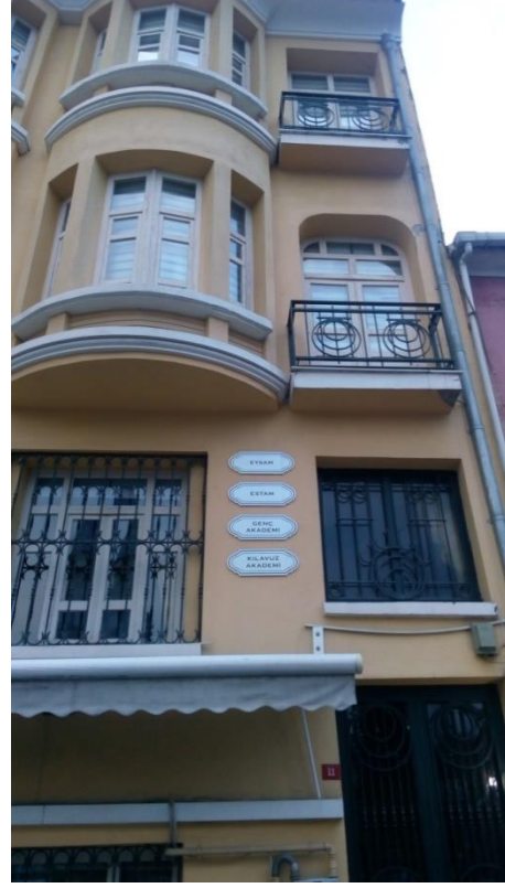
Resim 26 Eyüp/ Feshane Caddesi

Eyüp'teki birçok tarihi binaya göre halen görünebilir halde. Galiba hala içinde yaşayanlar var. Yoksa çoktan ihya ederdik.