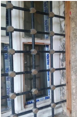
Resim 12 Eyüp/ Mihrişah Sultan Sıbyan Mektebi

Kemerli taş bir kapıdan geçtiniz ve karşınıza şöyle bir avlu çıktı. Ne düşünürdünüz? Bu ne böyle ne kadar berbat izbe bir yer mi? Ben böyle düşündüm. Ne veya neresi olduğunu bilmediğim bu mekânın kapısından kafamı uzattığımda merak etmesem içeri davet edeceği yerde kaç kurtar kendini diyen bu mekâna girdim. İyi ki de girmişim. Gözlerim gördüklerine inanmasa da buranın bir sıbyan mektebi olduğunu görünce ruhumdan bir şeyler kopmuş gibi oldu.