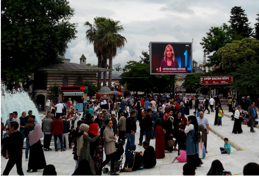
Resim 9 Eyüp Meydan

Şehrin ruhunu en iyi ifade eden mekân olan Eyüp 'ün meydanına biraz dışardan baktığımızda bunun ne kadar doğru olduğunu anlıyoruz. Ruhumuzun tam orta noktasında dev bir ekran, etrafında kargaşa ve bekleyiş var.