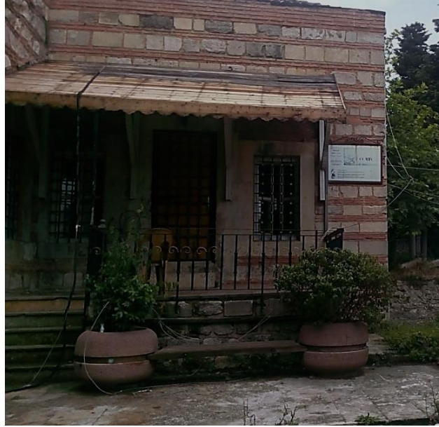
Resim 3 Eyüp/ Mihrişah Valide Sultan Sıbyan Mektebi

Günümüzde ise bu geriye kalan tarihi doku her ne kadar korunmaya ve tekrar kullanılabilir hale getirilmeye çalışılsa da yapılan çalışmalar yeterli değildir. Çünkü hala Eyüp'ün ara sokaklarında birçok unutulmuş tarihi ve mimari değere sahip yapı bulunmaktadır (örneğin, Mihrişah Valide Sultan Sıbyan Mektebi (resim: 3) veya Silahtarağa da bulunan Abdullah Ağa Çeşmesi (Resim: 4) gibi).