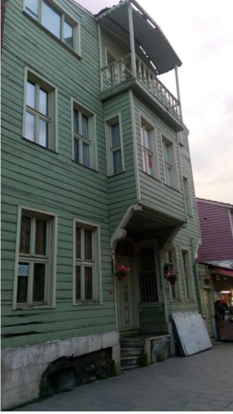
Resim 25 Eyüp/ Feshane Caddesi

Eyüp'teki birçok tarihi binaya göre halen görünebilir halde. Galiba hala içinde yaşayanlar var. Yoksa çoktan ihya ederdik.