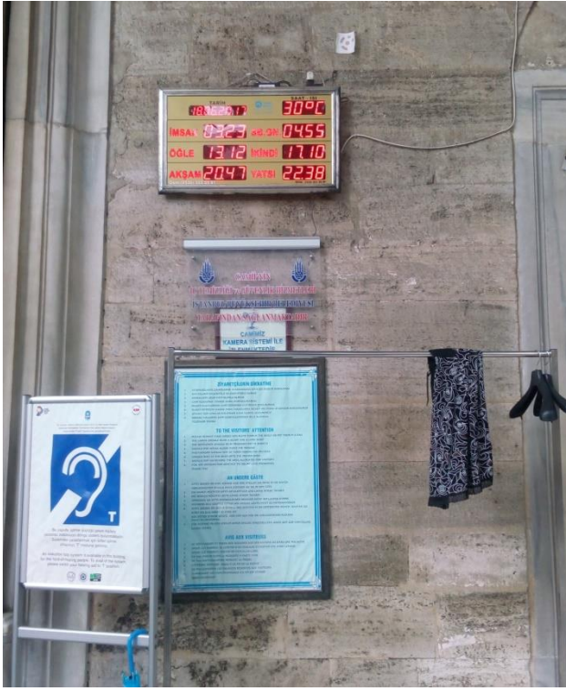
Resim 13 Eyüp Camii

Bu görselde “Namazda gözü olmayanın ezanda kulağı olmazmış” atasözünün Eyüp’te vücut bulmuş hali. Neden camilerimize şu çirkin altın sarısı ledli levhaları reva görecektik kadar zevksiz olduk acaba. Bunun birde hadisli olanı var. Çok şükür buraya konulmamış.