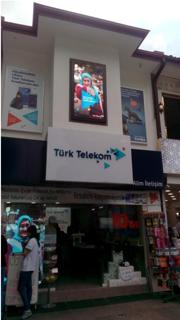
Resim 18 Eyüp/ Fahri Korutürk Caddesi

Energy kelimesine gözünüz takıldı ise arkadaki muhteşem yapıyı nasıl görebilirsiniz ki!!!