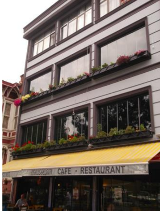
Resim 7 Kızıl Mescit Sokak

Bu fotoğraftaki kafe ortama uyumlu yeni bir tasarıma sahiptir. Ancak satılan ürünlerin tanıtımı için kullanılan görseller bu uyumu bozmaktadır. Mekân güzel gibi az çok ortama uyum sağlamış. Ancak gördüğümüz şey bol bol dondurma reklamı. Sabah saatleri olduğu için çok belli olmasa da yazılanları yeterli görmemiş olacaklar ki led tabelada mevcut.