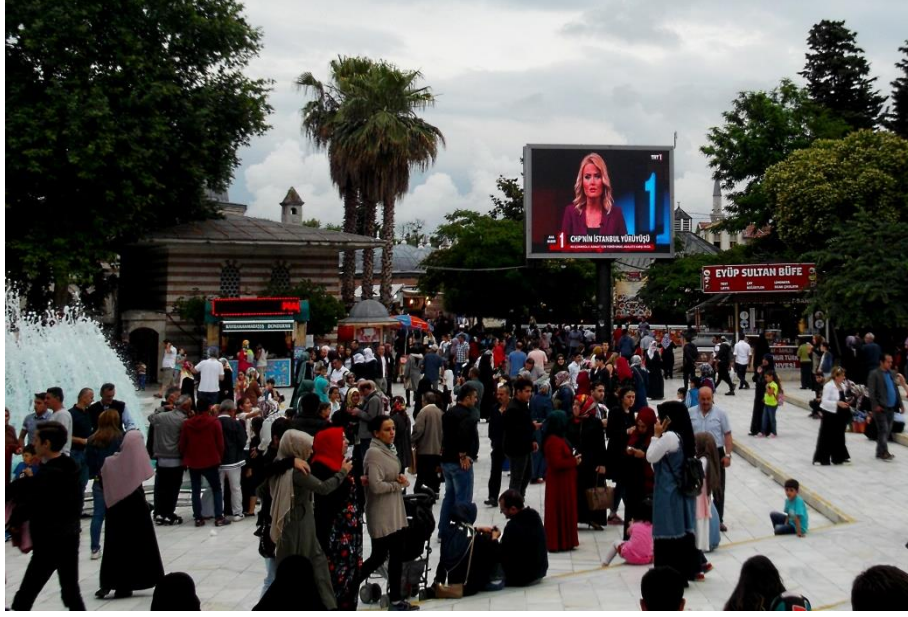
Resim 6 Eyüp Camii Meydanı