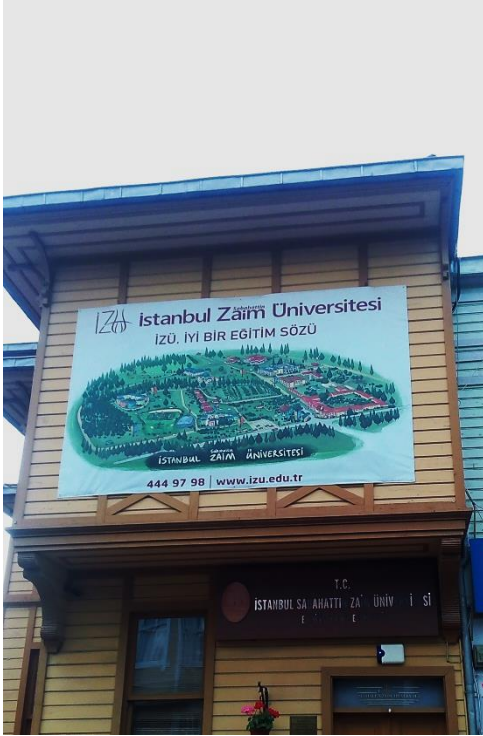
Resim 20 Eyüp/ Feshane Caddesi

Bir başka güzel sokak. Ama fotoğrafı ortadan ikiye bölüp üst kısma bakarsanız. Elinizle kapatsanız da olur.