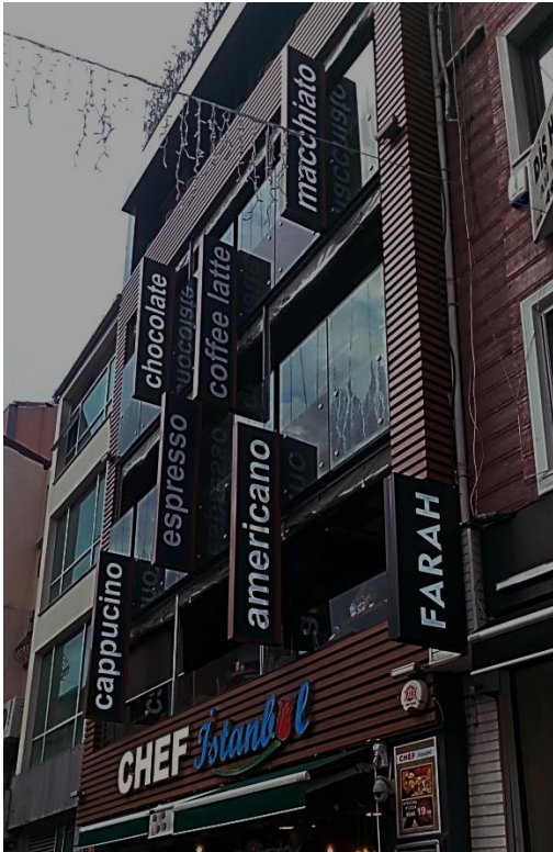
Resim 8 Eyüp/ Fahri Korutürk Caddesi

Bu fotoğraftaki kafe ortama uyumlu yeni bir tasarıma sahiptir. Ancak satılan ürünlerin tanıtımı için kullanılan görseller bu uyumu bozmaktadır. Mekân güzel gibi az çok ortama uyum sağlamış. Ancak gördüğümüz şey bol bol dondurma reklamı. Sabah saatleri olduğu için çok belli olmasa da yazılanları yeterli görmemiş olacaklar ki led tabelada mevcut.