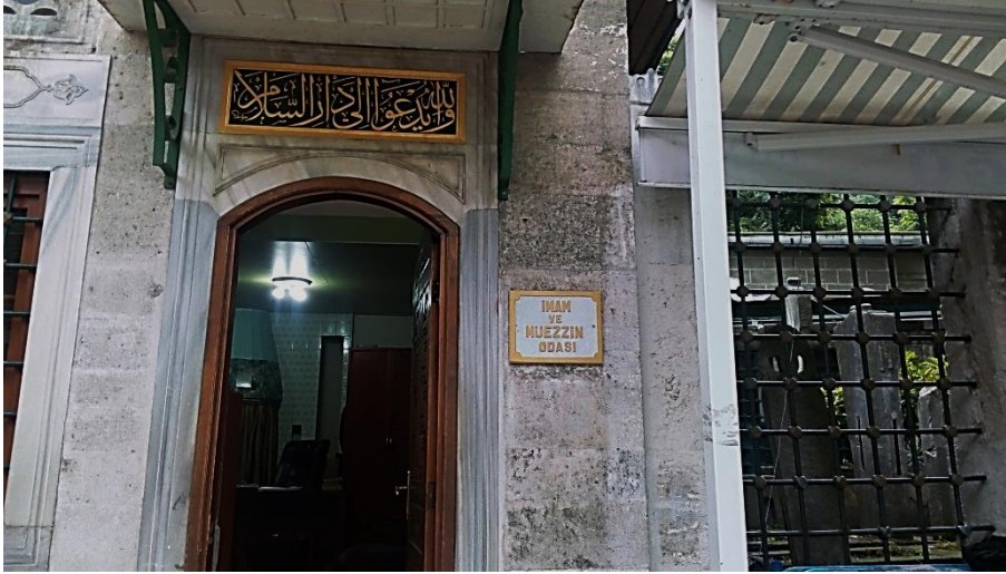
Resim 24 Eyüp Camii

Eyüp’ten güzel bir örnek olmaya aday fırın tabelası. Tabi ki üzerindeki yanındaki diğer yerler yapılan güzel uygulamayı kapatmış durumda.