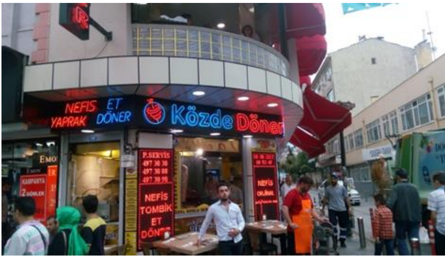
Resim 22 Eyüp/ Fahri Korutürk Caddesi