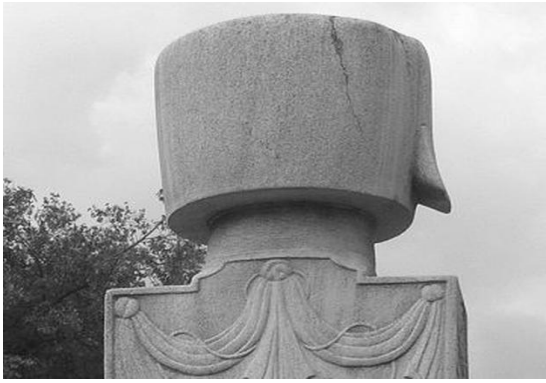
Şekil 4. Eyüp Sultan Haziresi'nde bir başlık

Tarikat taçları; Mevlevi Tacı, Bektâşi Tacı, Kadiri Tacı, Nakşi Tacı, Sümbüliye Tacı.