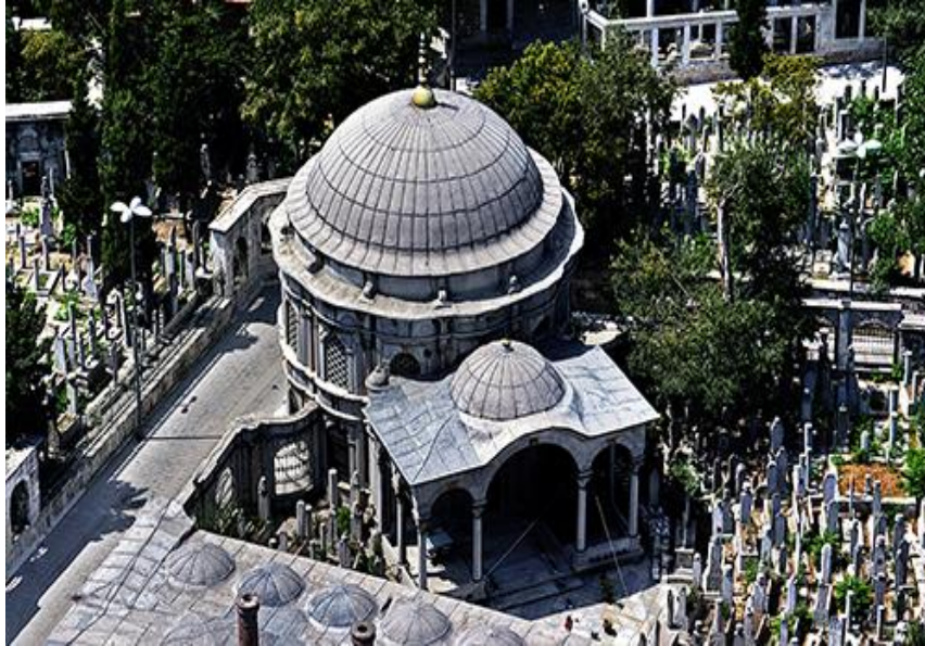
Şekil 1. Mihrîşah Sultan imarethanesi ve haziresi (Eyüp)

Osmanlı topraklarında ise ölülerin defnedildiği yerleri genel olarak üç kısma ayırabiliriz. Bunlar: Türbeler, genel mezarlıklar ve hazirelerdir. Türbeler, genel olarak önemli şahsiyetlere ait olup belli bir yapı içinde bir veya birkaç sayıdaki metfundan oluşur. Genel mezarlıklar birden fazla kişinin defnedildiği mekanlar olup hazireler ise genellikle bir camii veya bir yapı etrafında gömülü olanların bulunduğu yerlere verdiğimiz isimdir.