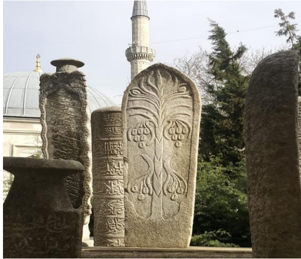
Şekil 5. Eyüp Sultan Camii Haziresi

Osmanlı mezar taşlarında kullanılan motifler mezar taşına güzellik kattığı gibi bu motiflerin kullanılma amaçları da vardır. Motifler genellikle Kur'an-ı Kerim'de geçen meyvelerden, servi ağacından ve nuru temsil etmesi bakımından işlenen lamba şekillerinden oluşur. Meyve motiflerinin amacı ölen kişinin ardından yaratıcıdan ona gösterilmesi dilenen lütfun göstergesidir. Anlamı ise ölen kişiye ahiret hayatında güzel meyvelerden ona ikram edilmesinin istenilmesidir. Servi ağacı da tevhidi temsil etmektedir. Lamba motifi, ahiretten evvelki kabir hayatında ölen kişinin kabrinin aydınlanması ve kabrinde azap çekmemesi niyetiyle yapılan en hoş motiflerden birisidir. Osmanlı Devleti'nin hüküm sürdüğü topraklarda, mezar taşlarındaki bu incelikleri şahit olunabileceği gibi en güzel örnekleri de yine şüphesiz Payitaht'ta görülecektir. Bir çok semtinde ayrı ayrı güzellikler ve önemli şahsiyetler olduğu aşikâr olsa da bu şehirde koskoca bir devrin yattığı yer ve her karışında ayrı bir şahsiyetin hikayesinin bulunduğu ve en önemlisi de Ebu Eyyüb El-Ensari'nin metfun olduğu Eyüp İlçesi, Osmanlı mezarlıklarını anlamamız için devasa bir laboratuvardır. Osmanlı mezarlıklarına dair bahsedebileceğimiz ne varsa Eyüp Mezarlıkları'nda görmemiz mümkündür.