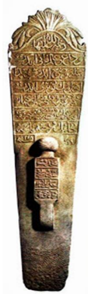
Şekil 6. İstanbul'lu Hanife Hanım'a ait mezar taşı

Kadın mezar taşları Osmanlılar'ın mezar taşlarına uyguladığı sanatın en zarif örneklerini gösterir. Aynı zamanda çocuk mezar taşları da ince düşünülerek yapılmış olduklarının canlı örnekleridir. Kadınlara hayatlarında da önemli değerler veren Osmanlılar vefat ettiklerinde de mezar taşlarına ihtişamlı bir görüntü vererek son anlarında da verdikleri değeri göstermişlerdir. Kadın mezar taşlarında sık rastlanılan motif ise yine çiçek motifleridir. Çocuk mezar taşları ise oyuncak şekillerinin andırır. Ancak en ilginç ise ergenlik yaşını geçmiş olan çocukların mezar taşlarının aynı boyutlarda yapılırken ergenlik çağından önce vefat eden çocukların mezar taşlarının öldükleri anki boy uzunluklarına göre yapılmış olmasıdır. Evlilik yaşına gelmiş lakin evlenmeden vefat etmiş genç bir kızın mezar taşına kırık gül motifi işleyen, bebeğini doğuramadan karnında çocuğu ile 1735 yılında vefat eden İstanbul'lu Hanife Hanım için yapılan mezar taşı Osmanlı'nın mezar taşlarına, insanına ve estetiğe ne kadar önem verdiğinin en somut delilleridir.