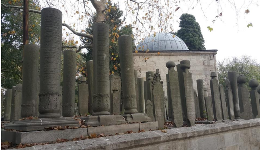
Şekil 2. Eyüp Sultan Haziresi

Osmanlı'daki müslüman mezar taşları genellikle belirli bir ifade ile başlar. Bu ifade Kur'an-ı Kerim de geçen ayetlerden olup sık kullanılanlardan bazıları; "Hüve'l-Baki", "Küllü men aleyha fan" ve "Küllü nefsin zaikatül mevt"tir. Anlamları ise sırası ile: "Baki olan O'dur", "Her şey fanilik üzeredir" ve "Her nefis ölümü tadacaktır" olan bu ifadeler mezar taşlarının başlarında yer alırlar. Bunlar Allah'a yakarışın ve insanın ölümlü olduğunu vurgulamanın birer göstergesidir.