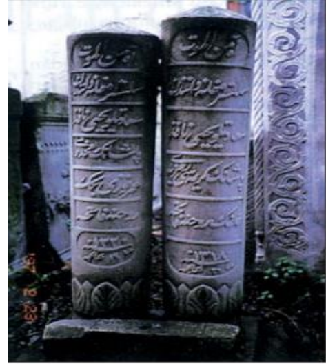
2. Eyüpsultan Camii baziresinden, Yahya Hafız Paşa'nın kızı Remziye Hanım ve oğlu Ömer Fevzi Bey'in mezar taşları.