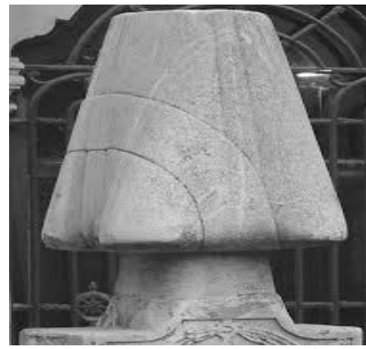
Şekil 5. Kallavi Kavuk

“Osmanlı erkeğinin mümeyyiz vasıflarından biri de başlarındaki kavuklarıydı. Kavuksuz ya da son dönemde fessiz sokağa çıkmak, kimliksiz çıkmak gibiydi onlar için. Yalın ayak sokağa çıkmak neyse, başı açık sokağa çıkmak da o idi.” 3 Dönemlere ve kullanan kimselerin statülerine göre farklı isimlere sahip olsa da kavuklar Osmanlılar için önemli başlık türüydü. Türlerine göre sadrazamların, defterdarların, nişancıların ve kimi zaman da padişahın taktığı kavuklar vardı. Bunlardan en göze çarpan ve insanları etkileyen ayrıntısı ise örfi kavuklardır. Rivayetlere göre örfi kavukları hem hekimler hem de şeyhülislam efendi kullanırdı. Zira ikisi de insanları iyileştirmek için çalışırlardı. Biri bedeni iyileştirirken diğeri insanın kalbini ve imanını temizler ve biri olmadan diğeri hiç sayılırdı.